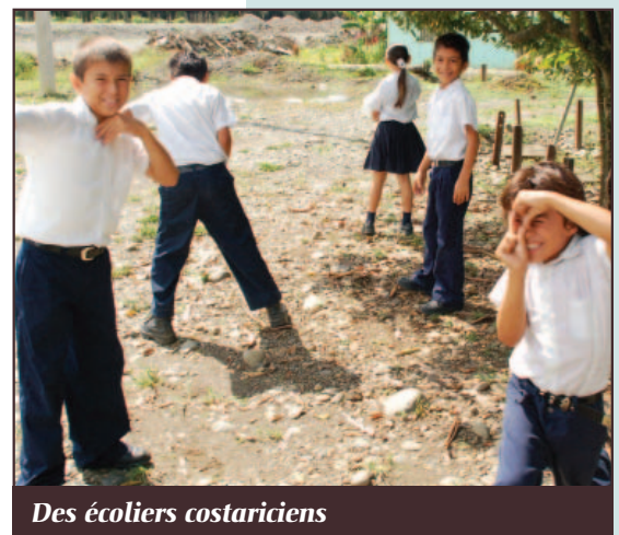
Des écoliers costariciens