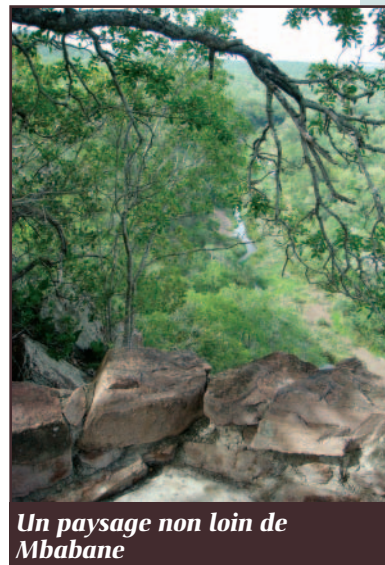
Un paysage non loin de Mbabane

« Le NERCHA est dans une position privilégiée lui permettant de coordonner la prise en charge de la pandémie. »