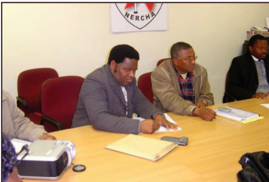
Signature de l'accord avec le Fonds Mondial