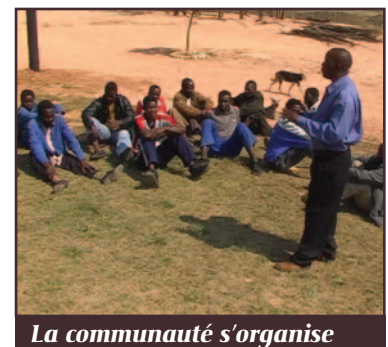
La communauté s'organise

1 National Emergency Response Council on HIV/AIDS